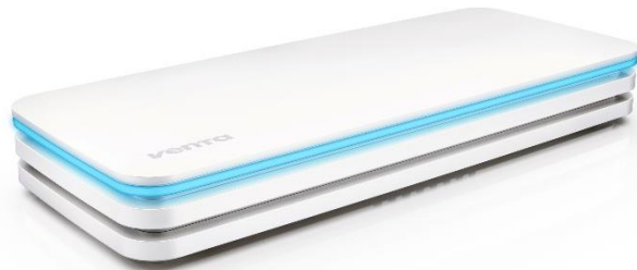
The Venta AirSense: available from end of October

De meeste mensen kennen de gevoelens die worden opgeroepen door het gevoel dat de lucht in een ruimte niet aangenaam is. Oorzaken hiervan kunnen een gebrek aan zuurstof, droge lucht of andere factoren zijn, maar het is vaak onmogelijk om de precieze oorzaak te achterhalen. Tot nu. Venta AirSense apparaten meten, bewaken en analyseren de componenten in de lucht, het klimaat van de ruimte, evenals overige externe factoren in realtime, met maximaal acht sensoren. De AirSense PRO meet factoren zoals fijnstof in drie maten 1 , kooldioxide CO 2 , VOC-gassen 2 , formaldehyde, evenals de luchtvochtigheid en temperatuur. De AirSense ECO meet daarentegen VOC-gassen, vochtigheid en de temperatuur. De verzamelde gegevens geven een zeer nauwkeurig beeld van de luchtkwaliteit in de ruimte, dat op twee verschillende manieren wordt gesignaleerd: allereerst geeft de kleur van de LED-lichtband op de AirSense aan wanneer een kritische waarde wordt gedetecteerd, en ten tweede kunnen de gegevens worden geraadpleegd via de Venta Home-app op de smartphone van de gebruiker.