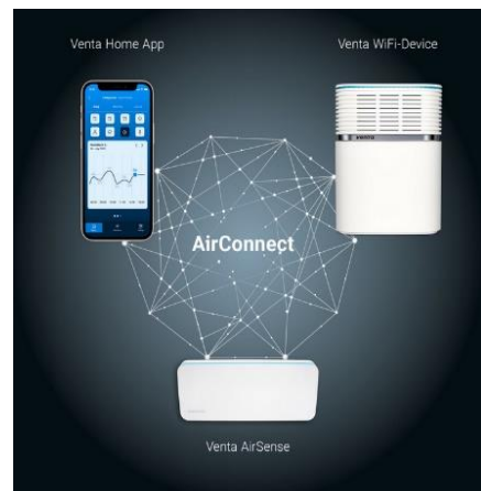
Fully integratable into the Smart Home with other Venta devices

Adviesprijzen voor de twee varianten zijn: € 279,00 voor de AirSense PRO en € 99,90 voor de AirSense ECO