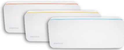
Three-level color system for displaying the air quality